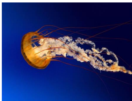
Fig. 1. Sea Bokeh Ocean Underwater Jellyfish